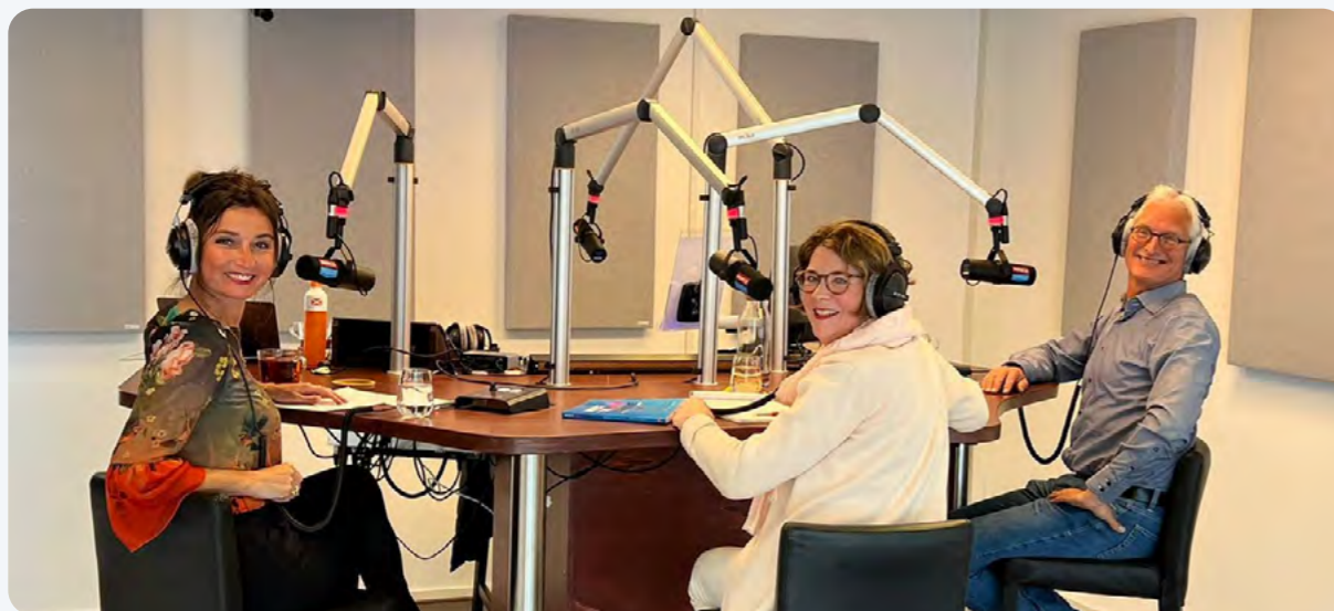
Een opnamedag van Coachradio in onze eigen studio in Zwolle.