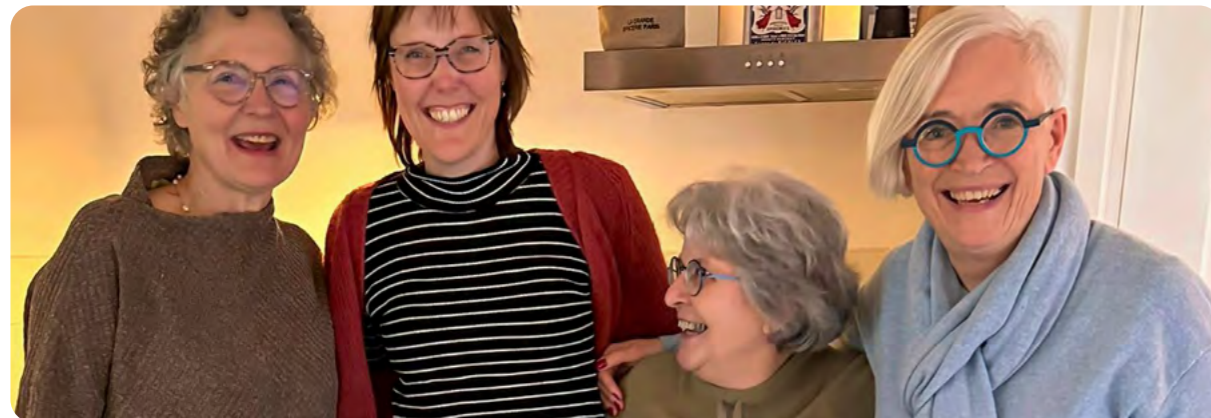
Het team kwaliteit, EIA en EQA bij elkaar.