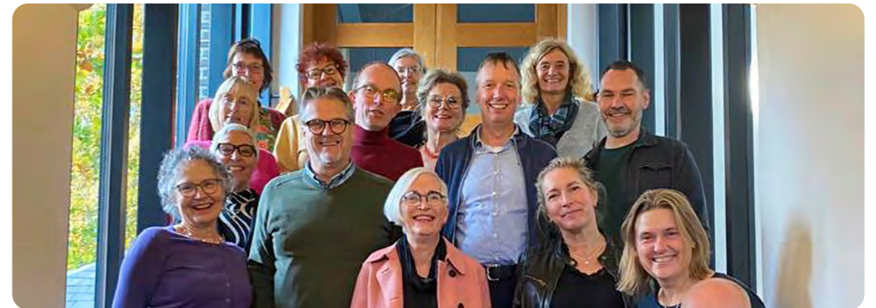
Alle EIA en EQA assessoren bij elkaar.